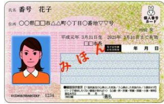
マイナンバーカードの見本（表）