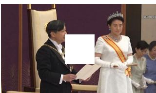
新天皇陛下「国民の象徴の責務果たす」 初のおことば