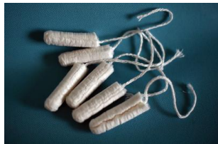
生理用タンポン (2016年2月24日撮影、資料写真)。【翻訳編集】AFPBB News

【AFP=時事】オーストラリア政府は3日、女性の生理用品を商品サービス税 (Goods and Services Tax、GST) の課税対象から除外すると発表した。生理用品に対する課税は別名「タンポン税」とも呼ばれ、豪国内で20年近くにわたり論争的となっていた。