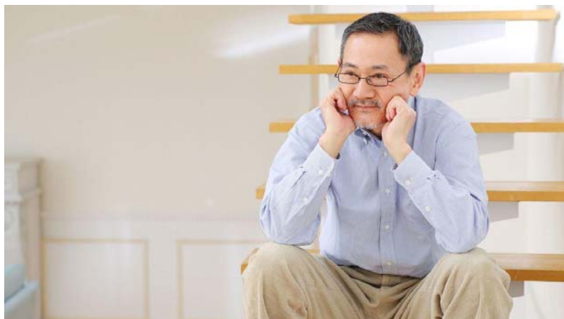
定年後、必ず「恐怖の請求書」がやってくる。落ち込むよりも、「払い過ぎた税金」を取り戻す方法がある

いいね! 332 シェア ツイート 一覧 コメント 11 G+ B! 印刷 A A