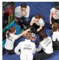
「そだねー」商標出願