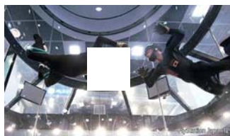
埼玉)爽快! 越谷に日本初 スカイダイビング」