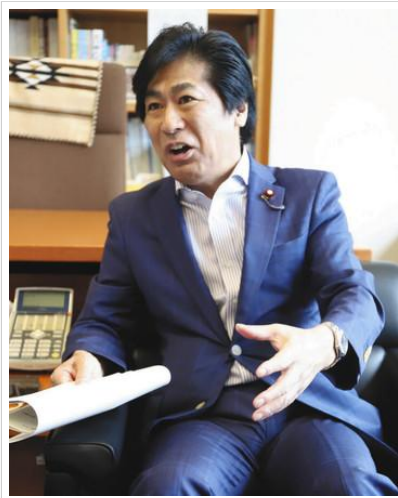
製薬マナーの透明化に向けた取り組みを振り返る田村憲久元厚労相＝東京・衆院議員会館で

二〇一四年七月、厚生労働省大臣室。当時の田村憲久厚労相は、情報公開が進まない製薬業界にしびれを切らし、厳しく宣告した。