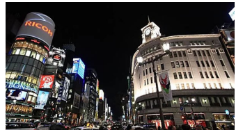
「この歳で男性に誘われるとは」54歳女性が14歳年下男性と出会った不思議な体験 (04/12) dot.