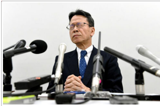
会見して金品を受け取ったことを認めた関西電力の岩根茂樹社長