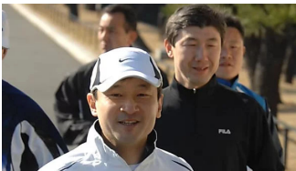
英国理髪店でそっけなくされるも…御理髪掛が見た新天皇陛下のお人柄 (07/26) 週刊朝日