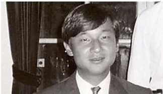
陛下は酒家だったがが雅子さまは…高級フレンチ支配人が明かす素顔 (05/01) 週刊朝日