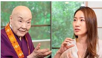
クビ宣言する瀬戸内寂聴が66歳年下秘書に送った手紙の秘密 (06/29) 週刊朝日