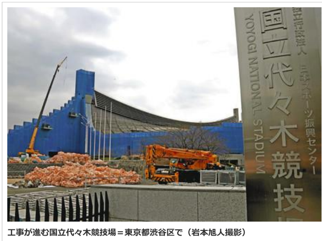
工事が進む国立代代木競技場=東京都渋谷区で

二〇二〇年東京五輪・パラリンピックの競技会場のうち、国立代代木競技場など既存の三施設の改修に、国が少なくとも二百四十三億円を負担することが分かった。国は五輪絡みの経費とみなしていないため、大会経費や関連経費に計上されず、隠れた格好になっている。大会を翌年に控える中、間接的な経費を含めた費用の全容はいまだに不透明なままだ。(原田遼、中沢誠)