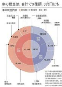
自動車関連諸税の内訳