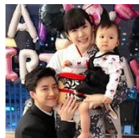
うれしい、お知らせ