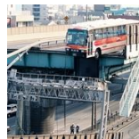
「奇跡のバス」続く交流