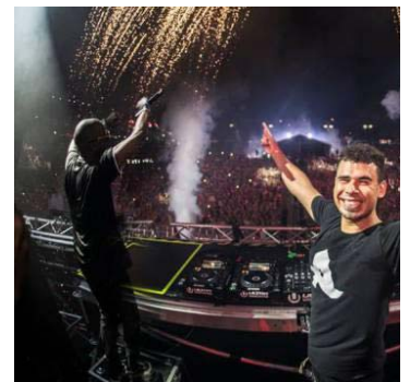
Alesso が ULTRA Europe にて2曲の ID を披露!