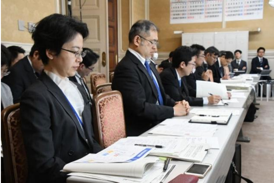
安倍首相のために役人たちは統計の改竄にまで手を染めた。= 3月8日、衆院16控室 =