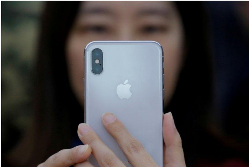
5月1日、大規模な自社株買いや増配を打ち出したアップルは、株主に対する記録的な大盤振る舞いによって、昨年の法人減税の最も明らかな「勝ち組」として躍り出た。北京で2017年10月撮影（2018年 ロイター/Thomas Peter）

【サンフランシスコ 1日 ロイター】 - 米アップル<AAPL.O>は、米税制改革に伴い本国還流させる莫大な資金を元手に、大規模な自社株買いや増配を打ち出した。株主に対する記録的な大盤振る舞いによって、昨年の法人減税による最も明らかな「勝ち組」として躍り出た。