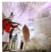
廃駅に巨大ウサギ？