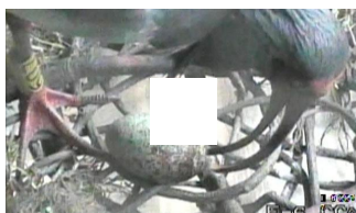
中国提供のトキが初産卵、4週間で孵化の見通し 佐渡