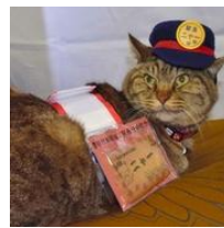
勤務は「やる気になったとき」