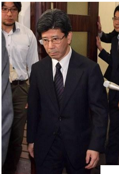
今月9日、国税庁長官を辞任した佐川宣寿氏