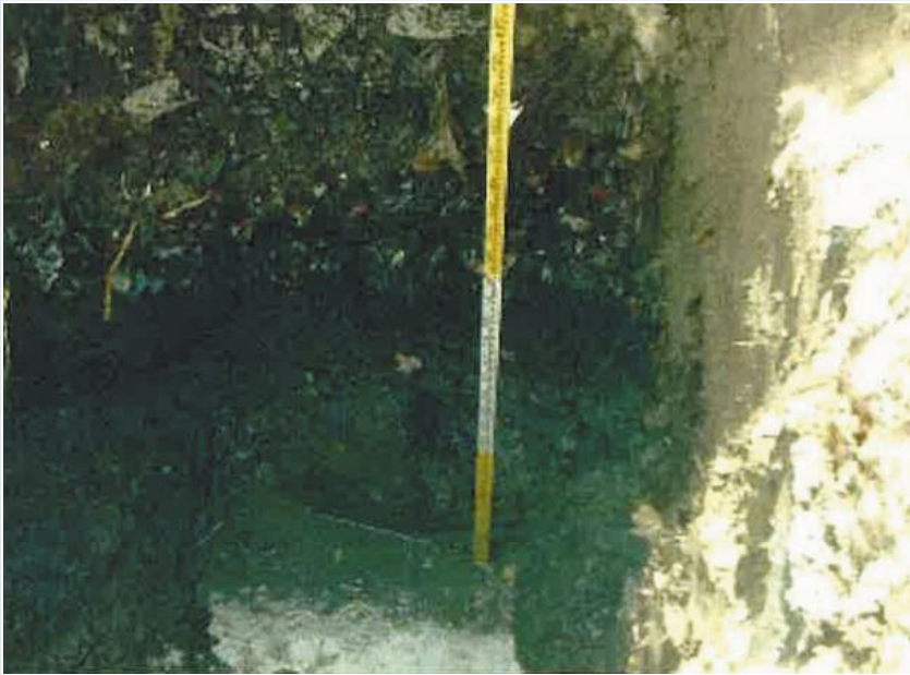
ごみが見つかったとされる国有地の試掘現場写真

学校法人「森友学園」への国有地売却問題で、約八億円の値引きの根拠となったごみの試掘に関わった業者が、大阪地検特捜部に対し、財務省近畿財務局や学園に求められ、ごみを実際より深くあるように虚偽の数字に変更したとの趣旨の説明をしていることが、関係者への取材で分かった。特捜部は国有地が不当に安く売却されたとする背任容疑で捜査。値引きの根拠が揺らぐ事態となっており、財務省の決裁文書改ざんとともに、不可解な値引きの経緯についても調べている。