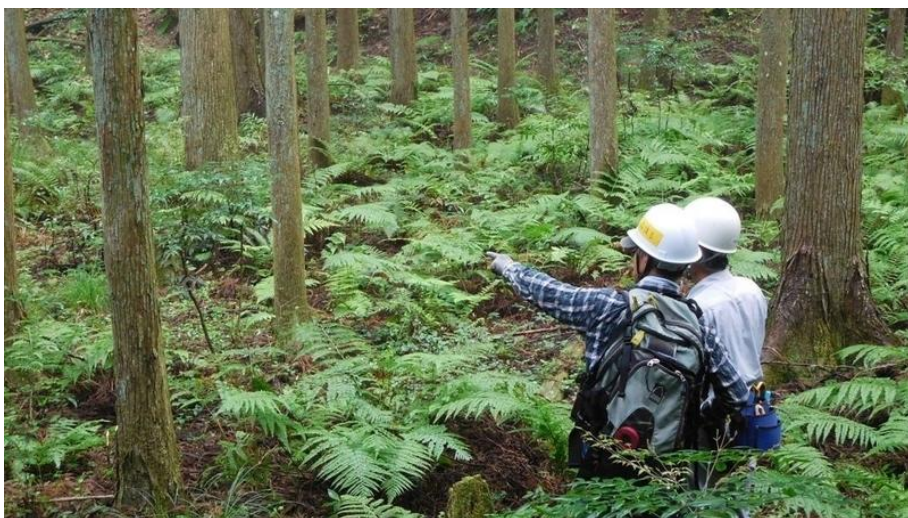
森林境界線の調査を行うNPOもあるが……。

昨年、所有者不明土地問題研究会が、長期間未登記の土地が全国で約410万ヘクタールにもぼり、九州の面積(約368万ヘクタール)を上回っていると発表した。