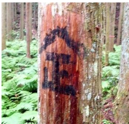
立木にあった所有者の書き付け

森林の境界をいかに探し出すか。方法は、登記簿と各種の図面を取り寄せて突き合わせながら、所有者や地元の山に詳しい人を交えて現地を歩き、地形や植生の違いなどを調べるしかない。木を植えたり伐った年代が違うのは所有者も違っていることが多いからだ。そして目印を探す。木に書き付けがあればよいが……あまり期待できない。