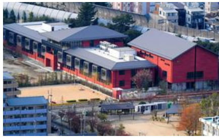
森友学園が国有地に開設予定だった小学校の建物 = 昨年11月、大阪府豊中市

学校法人・森友学園（大阪市）との国有地取引をめぐる、財務省の契約当時の決裁文書と、その後国会議員に開示された文書の内容が異なっている問題で、2016年の売却契約時の文書では1ページあまりにわたって記されていた「貸付契約までの経緯」という項目が、その後の文書ですべてなくなっていることがわかった。この項目には、財務省 理財局長の承認を受けて特例的な契約を結ぶ経緯が記されていた。